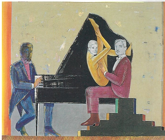
Ernesto Drangosch: Argentina S/título. Oleo